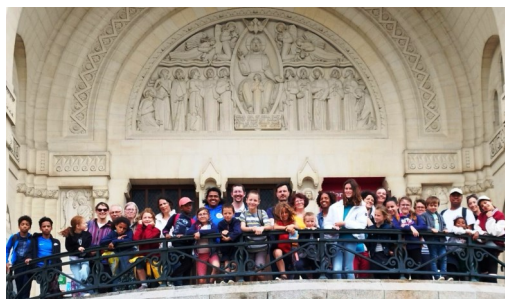
1er juillet : notre sortie de fin d'année à Lisieux.

La première rencontre a eu lieu samedi 23 septembre dernier ; les enfants et leurs parents ont découvert le personnage de Noé et ont approfondi l'épisode du déluge, fondateur d'une nouvelle Alliance de Dieu avec nous. La prochaine rencontre aura lieu le samedi 14 octobre.